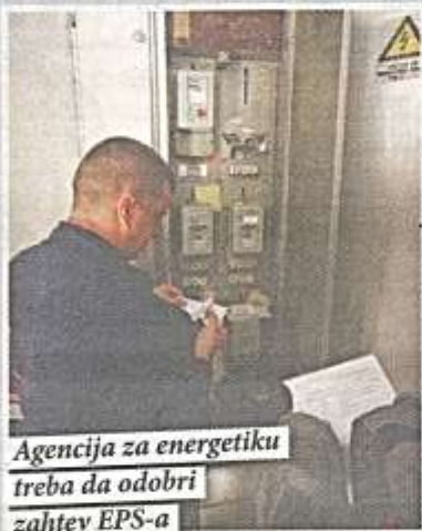
Agencija za energetiku treba da odobri zahtev EPS-a

Agencija za energetiku Republike Srbije (AERS) dobila je zvaničan zahtev EPS-a za poskupljenje struje za domaćinstva od 10,9 odsto, saopštila je AERS. U Agenciji su naveli da se može očekivati da struja poskupi od 1. avgusta, imajući u vidu da je neophodno da preduzeće „EPS snabdevanje“ 15 dana ranije obavesti potrošače o tome. Predlogu za poskupljenje struje prethodila je intervencija Agenci-