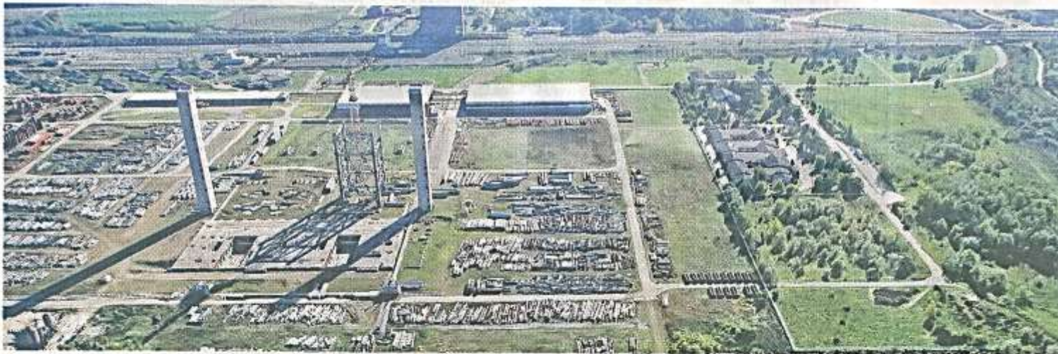
„Колубара Б“ деценијама чека градитеље

Једни најаве о улагањима у енергетику 10 милијарди евра не узимају сувише озбиљно, док други сматрају да се нешто ипак ради