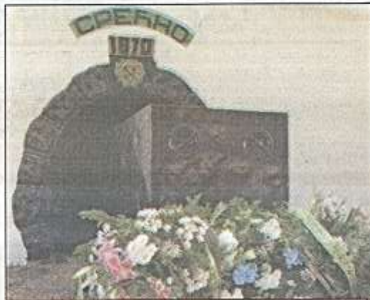
Venac na Spomen obeležju rudara: Stani Kostolac

bije, podsetivši da je jedino tu ostvaren rast od oko tri odsto godišnje. Želim da i vama i nama rudarski kažem srećno, poručio je na kraju Đačić.