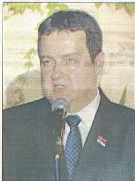
Ukinimo sve da politika koju vodimo bude merljiva: Ivica Dačić