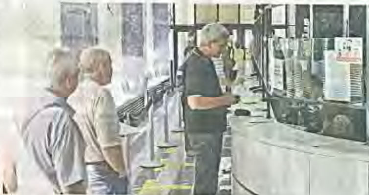
Шалтери као мера организационих способности директора

– Следеће недеље биће предузете мере против одговорних. Овак се ради о одговорности због начина на који су директори давали рачу-