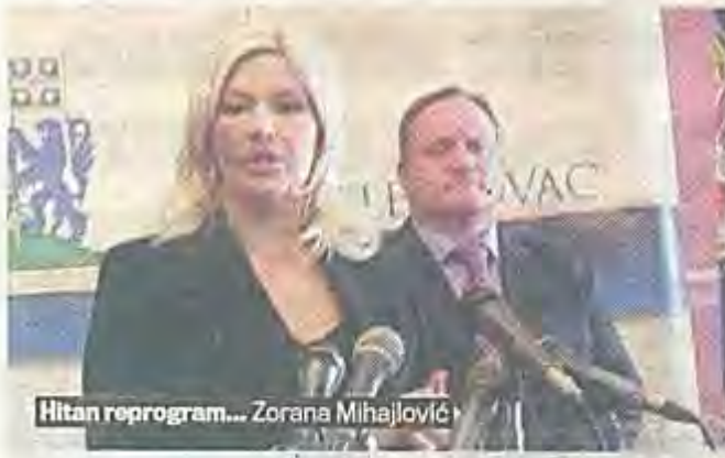
Hitan reprogram... Zorana Mihajlović