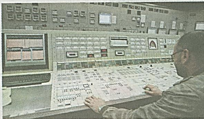
» KORPORATIVIZACIJA: Moguća ušteda od 100.000 evra dnevno

Međutim, napominju u EPS, na današnjoj sednici neće biti reči o pripajanju